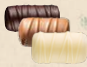
BÛCHE PRALINÉ Praliné tendre