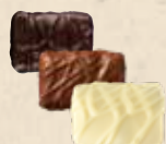
CASALEO Praliné au riz soufflé