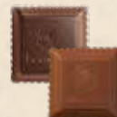
CARRÉ CROQUANT Praliné au riz soufflé