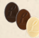
LOUISE Praliné saveur caramel, Praliné saveur caramel aux noisettes caramélisées