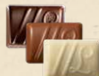
DUETTO Ganache au chocolat noir à la fraise et vinaigre balsamique ou au chocolat au lait, crème de nougat et graines de sésame ou au chocolat noir yuzu et saveur fruit du dragon

Ces chocolats ne représentent qu'une partie de notre offre.