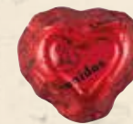
FOREVER ROUGE Chocolat au lait, praliné