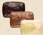
NOISETTE MASQUÉE Praliné avec une noisette entière