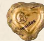
CAFÉ LAIT Chocolat au lait, crème confiseur au café